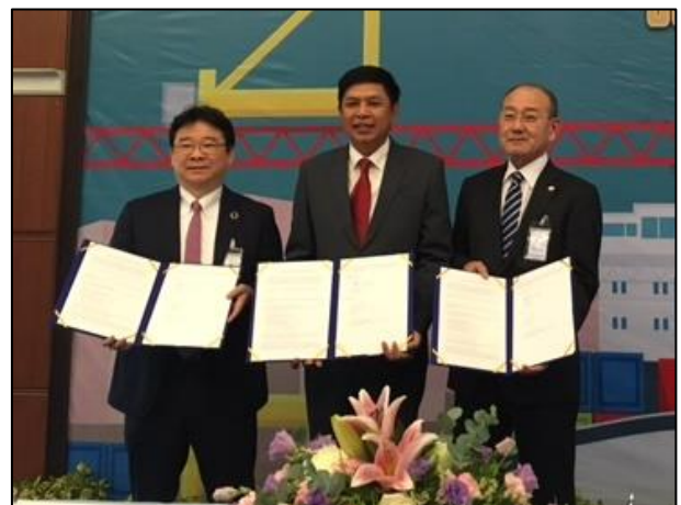
(写真：調印式の様子)